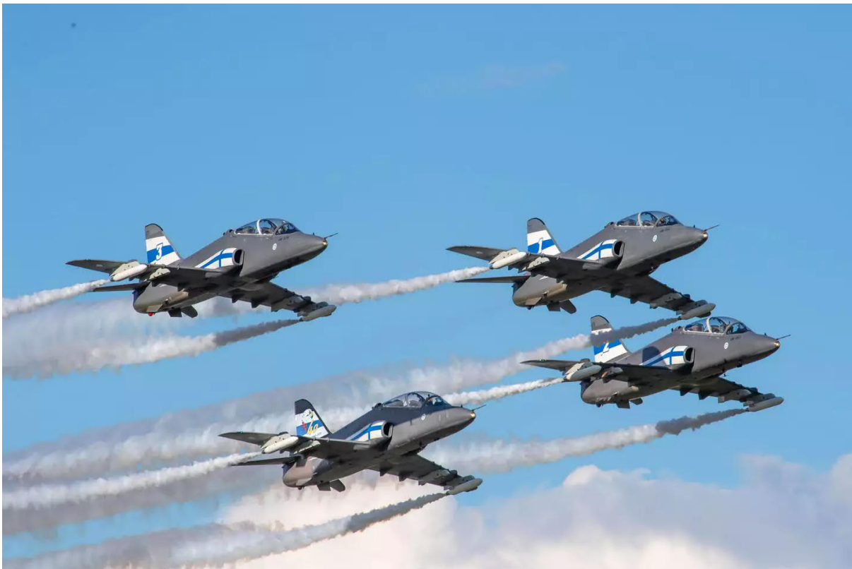
Kuvassa Ilmavoimien Midnight Hawks-osasto elokuussa Kauhavalla. Sen neloskoneessa näkyy sivuvakaajaan maalattu Hawk 40 years -tunnus.