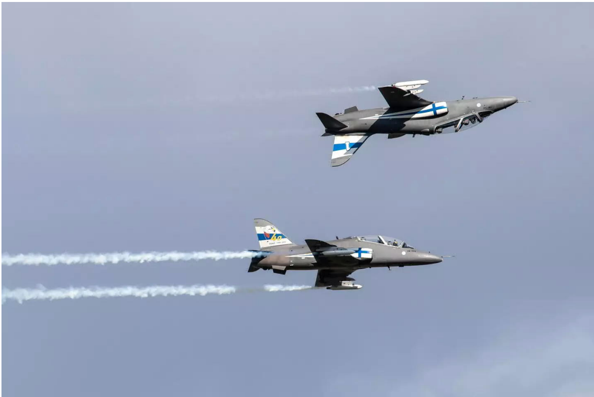
Midnight Hawks esiintyi Kauhavalla elokuussa. Alemmassa koneessa 40-vuotistunnus.